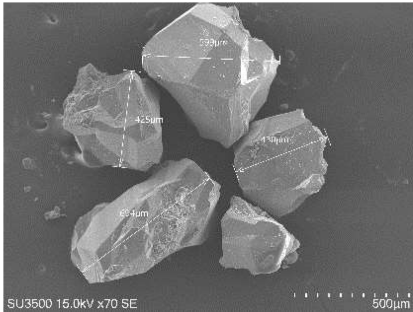
تصویر SEM مربوط به بلورهایی است که به عنوان هسته در آزمایش رشد بلور انتخاب شده اند

نمونه ها به مدت یک هفته در راکتور تحت دمای حداکثر ۲۵۰ درجه ی سانتیگراد قرار داده شدند. فشار لازم برای این آزمایش هم در اثر بخار شدن محلول تأمین شده ( \sim 1/5 \text{ kbar} ) در طی این مدت دمای هیترها به صورت جداگانه، هر روز دو نوبت به وسیله ی دما سنج لیزری اندازه گیری و ثبت شد. با توجه به عدم دسترسی به دماسنجی درون راکتور، مبنای حرارت آزمایش دمای اندازه گیری شده توسط دما سنج لیزری از بدنه راکتور در نظر گرفته شد. به دلیل زمان طولانی آزمایش و رسانایی بالای فولاد، به نظر می رسد دمای اندازه گیری شده از سطح بیرونی راکتور بسیار نزدیک دمای درونی آن باشد.